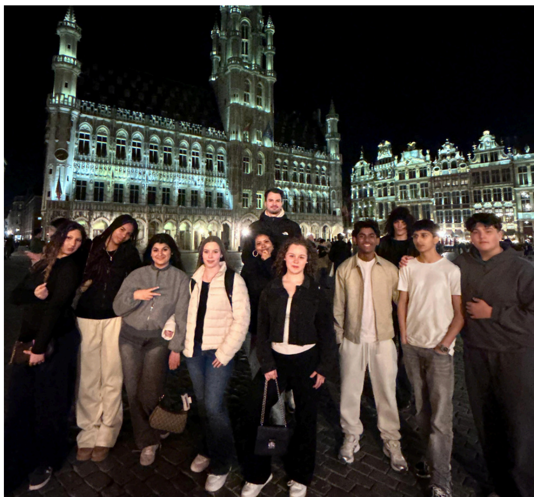
Schüler*innen der RaS am La Grand-Place